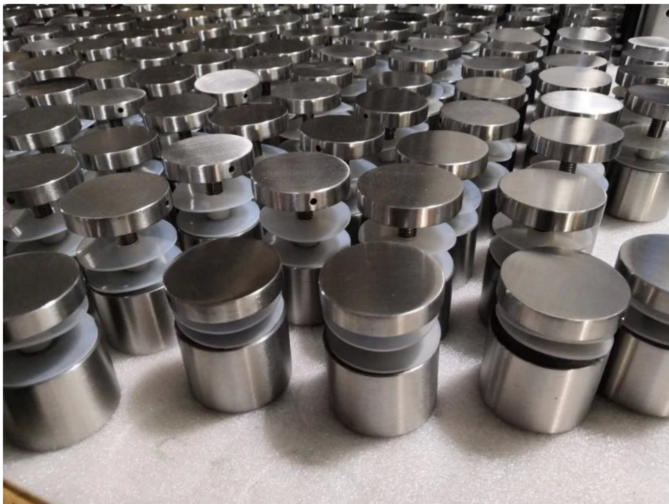
Foto di installazione di vetro Dreinings Standoff-