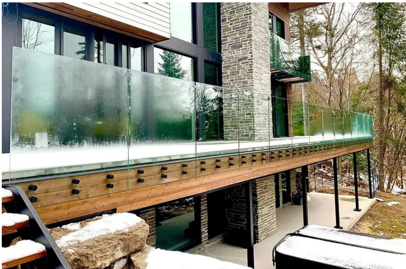
Altri modelli di sosta di vetro come sotto-