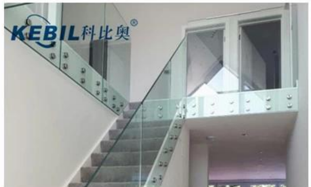
Altri disegni di staffa in vetro Stacket: