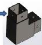
3-way tube connector

For tube dimensions Model 40×20×1.5(mm) S400 40×40×1.5(mm) S401 50×50×1.5(mm) S501 51×51×3.2(mm) S511 50×50×3.0(mm) S511A