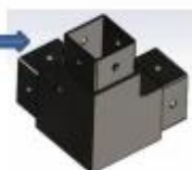
4-way tube connector

For tube dimensions Model 30×30×1.5(mm) S303 40×40×1.5(mm) S403 50×50×2.0(mm) S503 51×51×3.2(mm) S513 50×50×3.0(mm) S513A