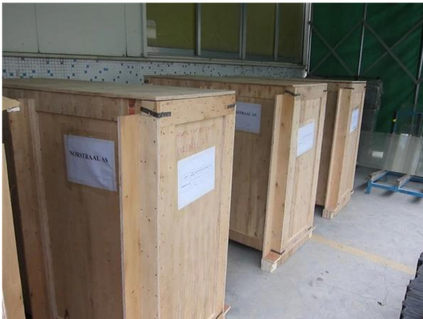
Progetto del progetto del cliente Foto di Design ringhiera in vetro portico in acciaio inox -