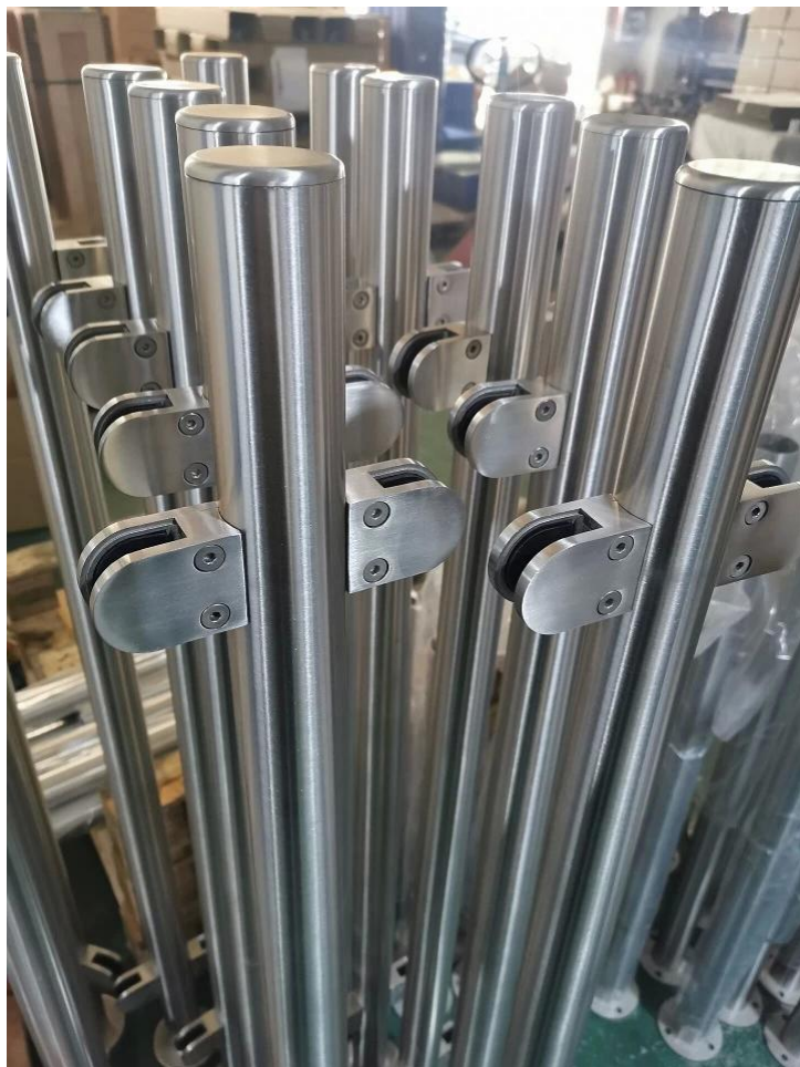
Tubo del corrimano rotondo: