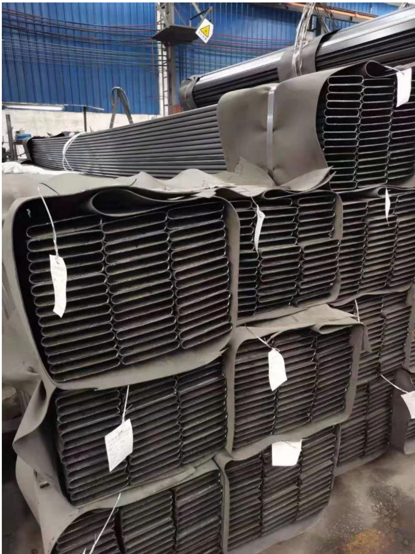
Dimensioni del tubo