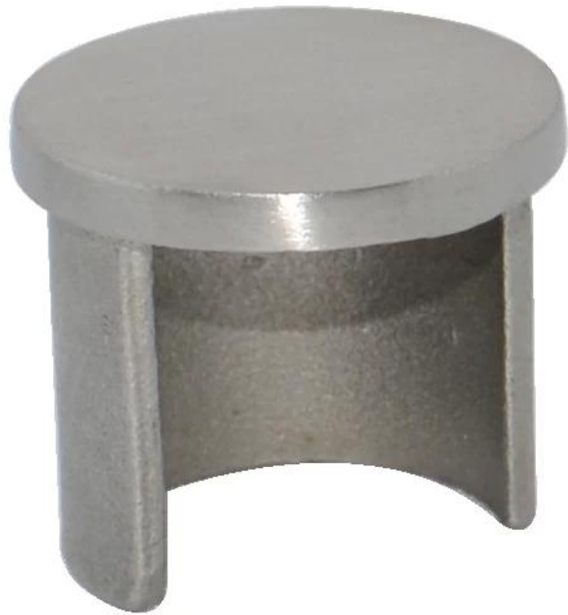
4. muro al connettore ferroviario