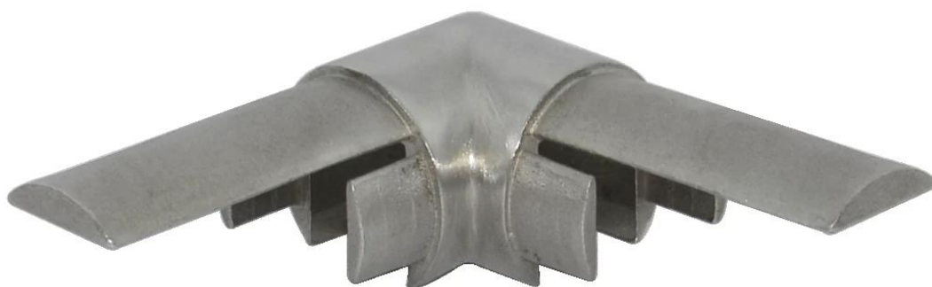
2 giunto centrale