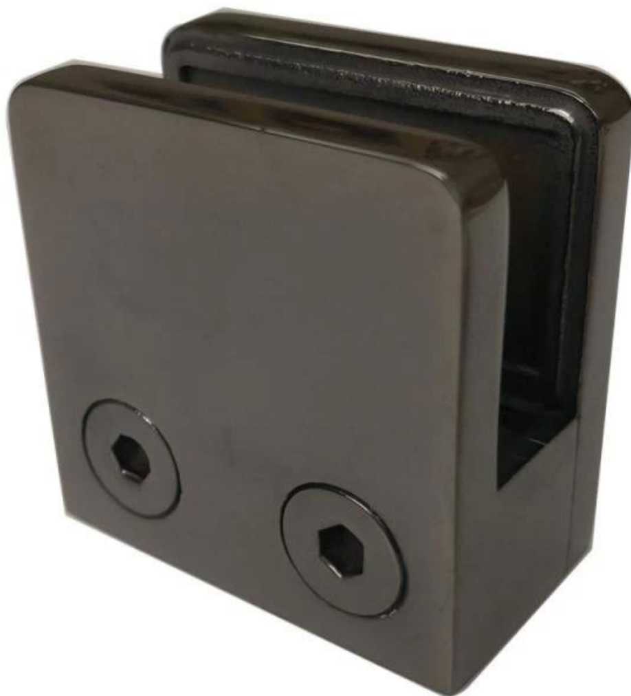
Morsetto per vetro in legno