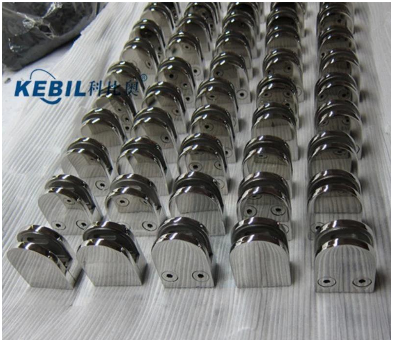
Morsetto in vetro nero