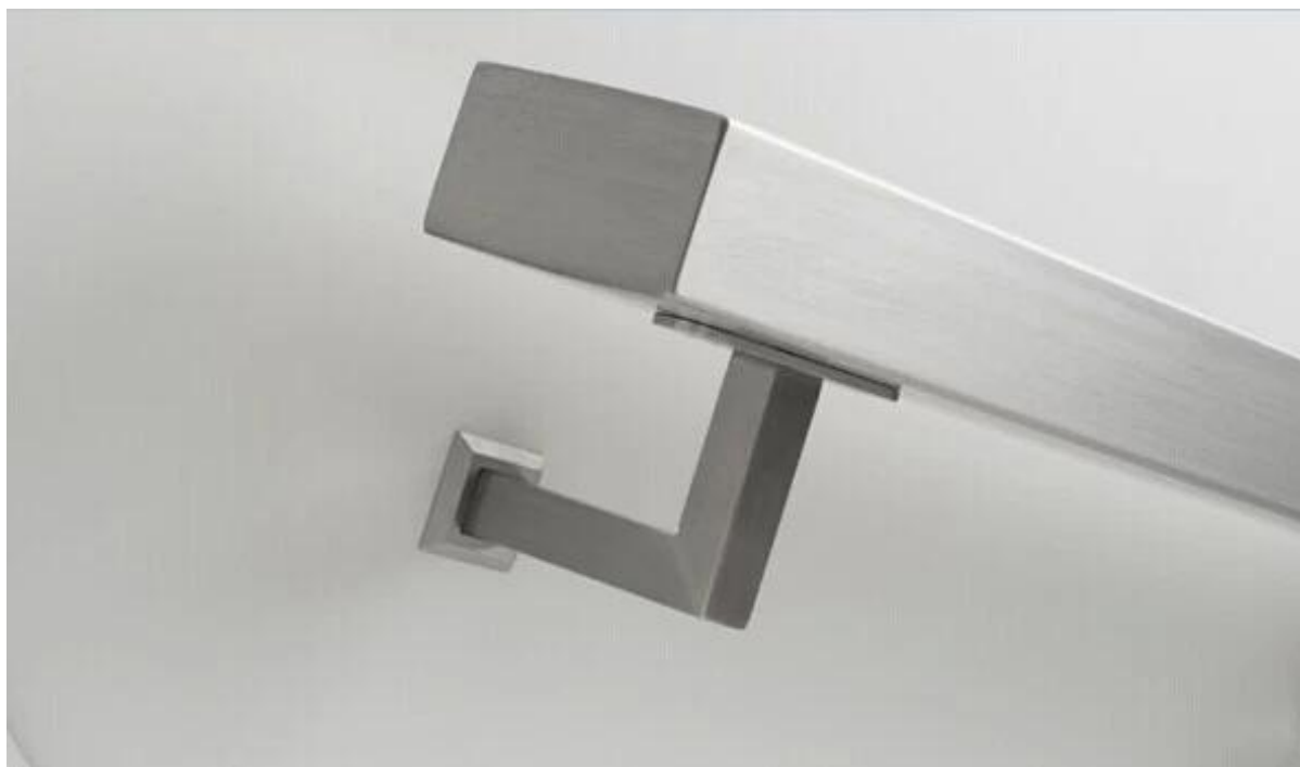
Staffa di supporto per corrimano quadrato con montaggio a pannello in vetro per corrimano a tubi quadrati: