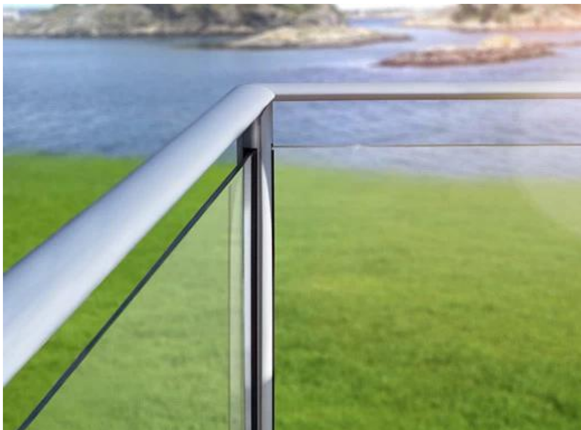
Sistemi balcone di vetro in acciaio inox: balcone ringhiera di design di alta 1.200 millimetri per edificio residenziale