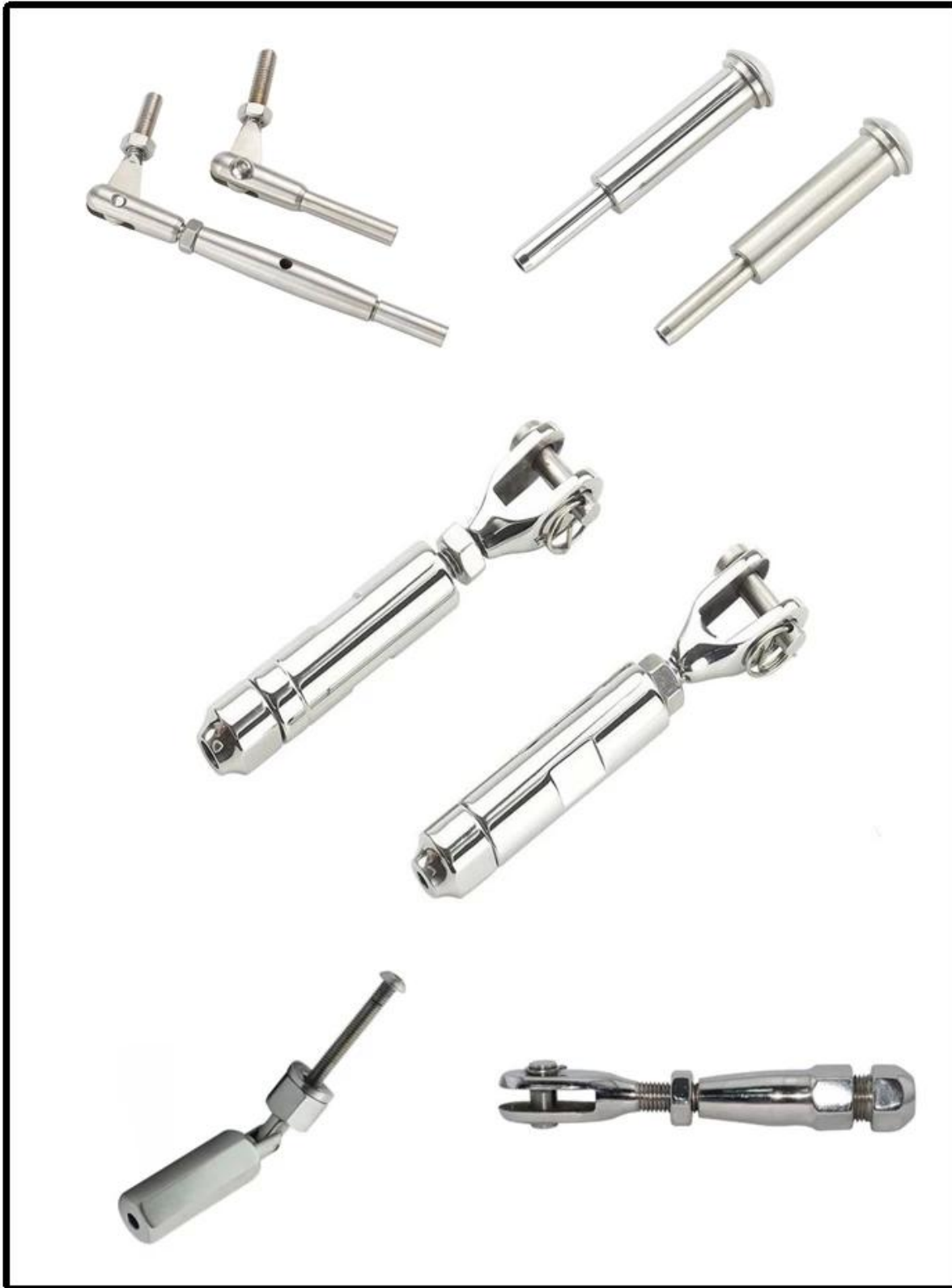
3). Foto di produzione di ringhiere per cavi -