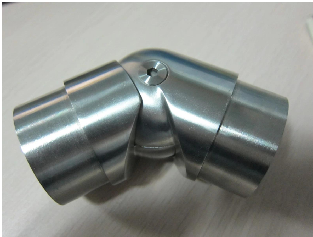
E302 90 gradi elbow