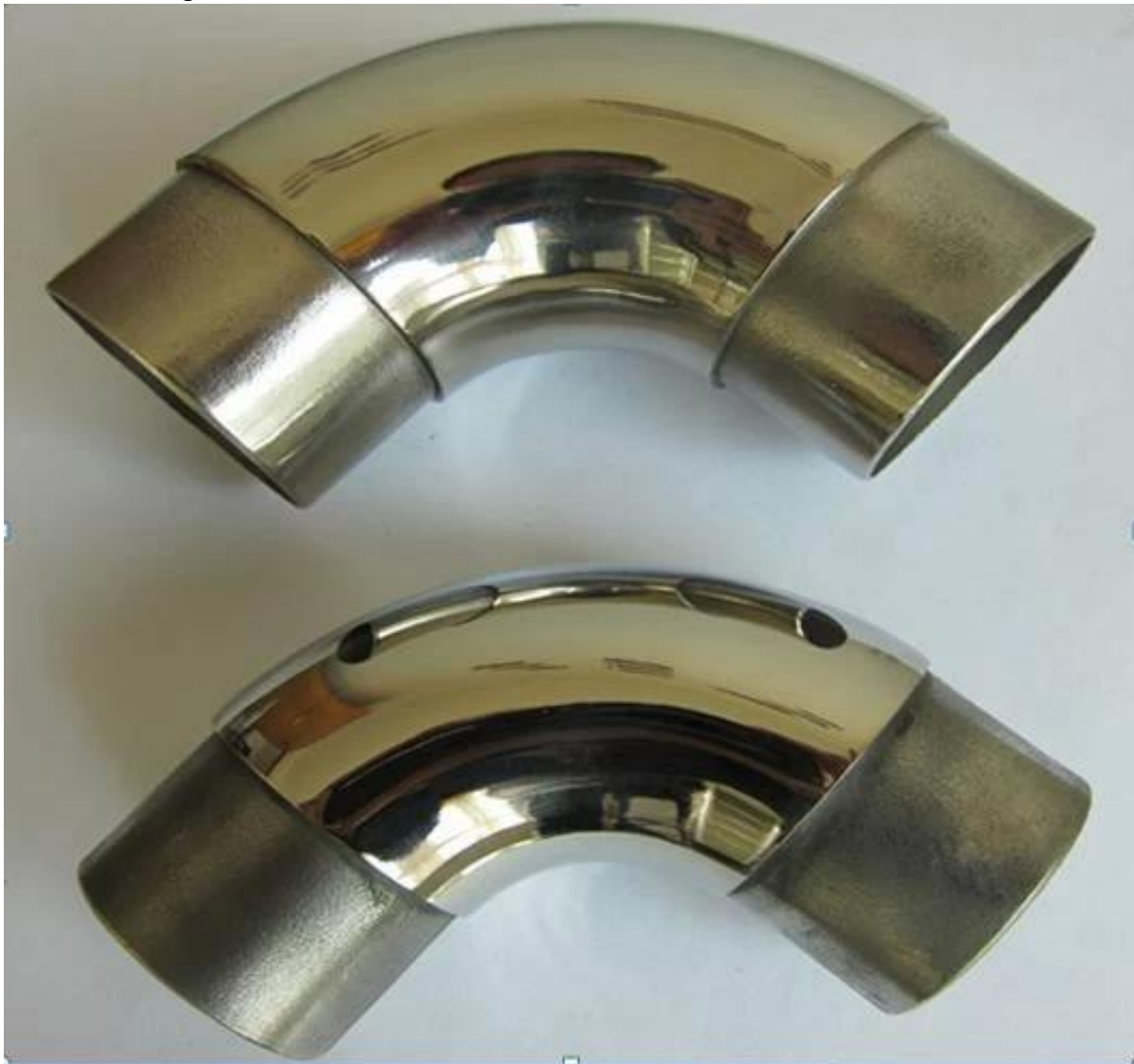
E304 mezzo tubo a gomito