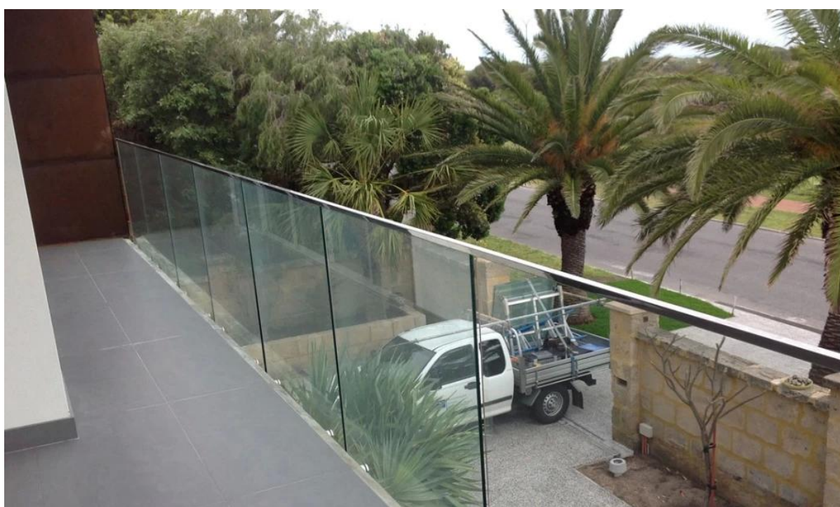
4. rubinetto di vetro per la progettazione ringhiera in vetro senza cornice :