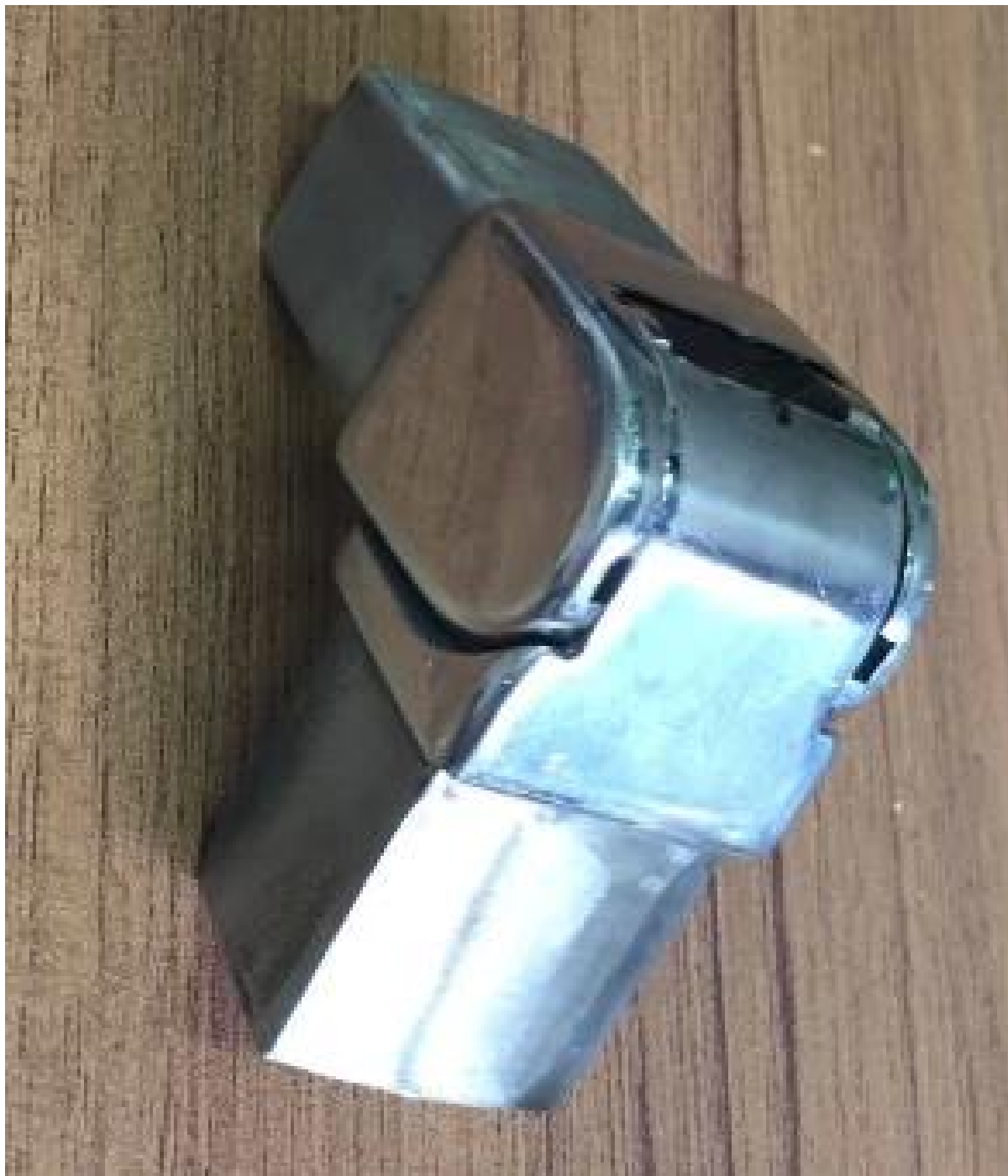
2) .Left / destra connettore regolabile.