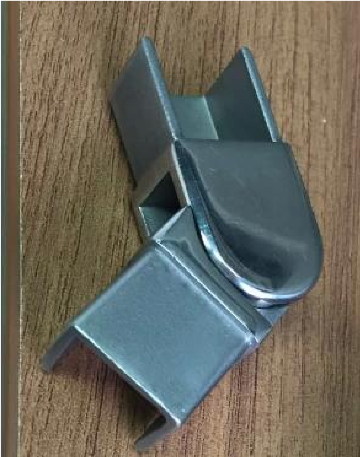
3. Fvetro balaustra di slot ferroviario montaggi del corrimano rameless progetto: