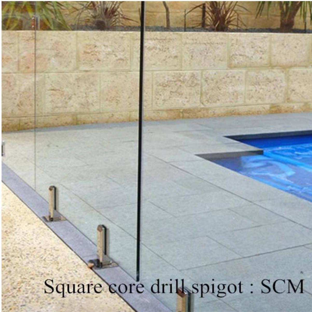
Perno piastra di base per il balcone: