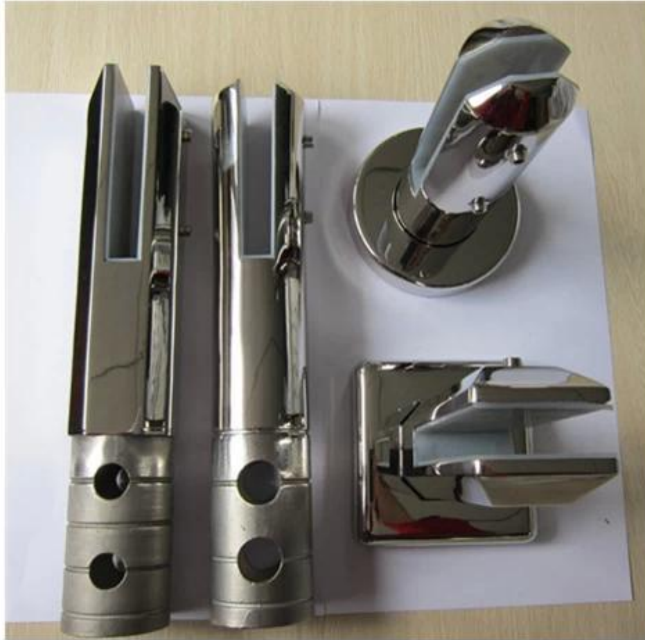
core drill and base plate spigot