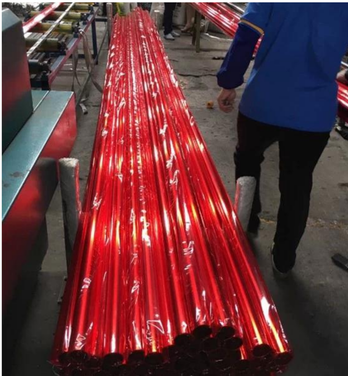
Pacchetto esterno di film a bolle,