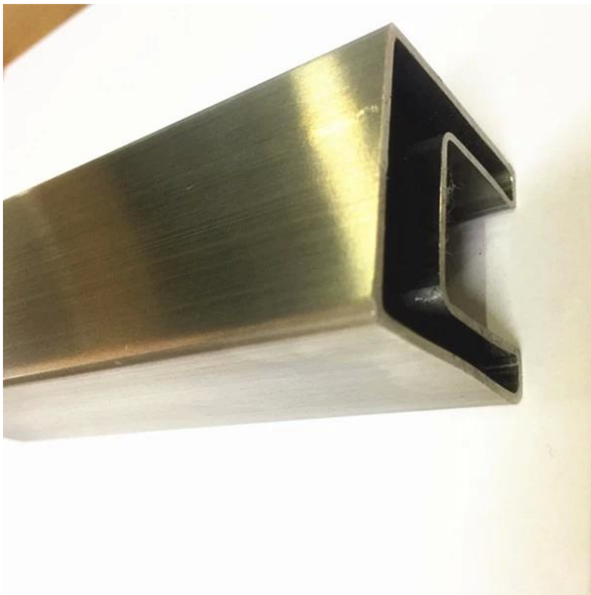
# 5. Tubo a fessura singola da 20 x 25 x 1,2 mm, 14 x 14 mm: