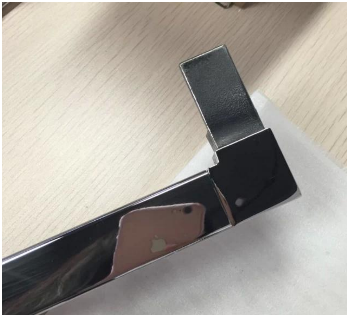
3. vetro ringhiera in acciaio inox barre superiori corrimano progetto raccordi: