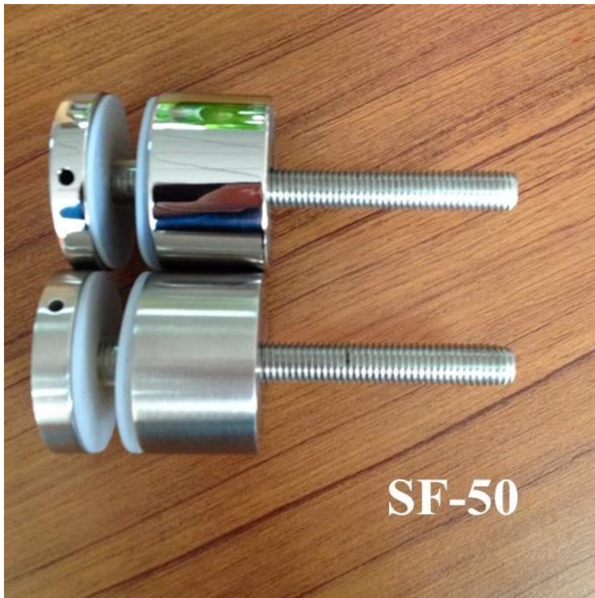
supporti distanziatori in vetro con viti per legno -