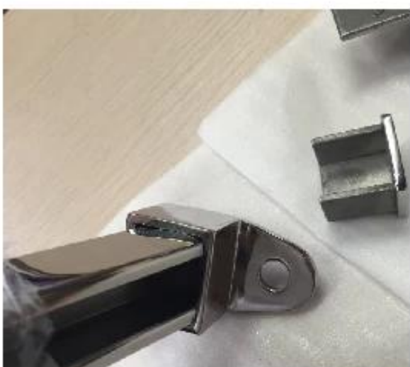
connettore regolabile per scanalato corrimano tubo sinistra Connettore / destra; su / giù connettore