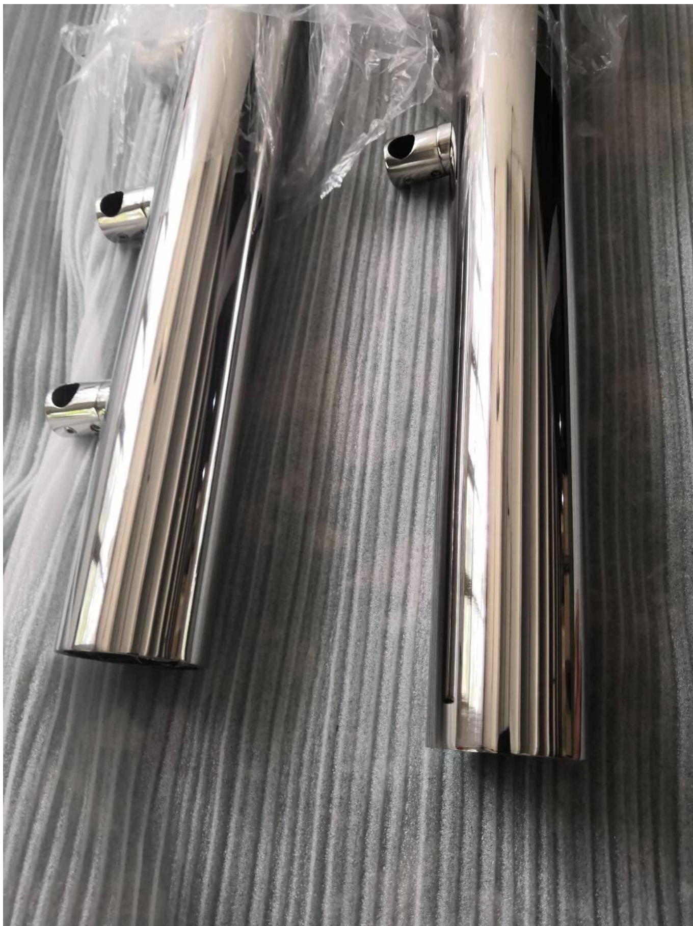
Vista dall'alto della ringhiera della barra trasversale in acciaio inossidabile 316, con supporti corrimano regolabili