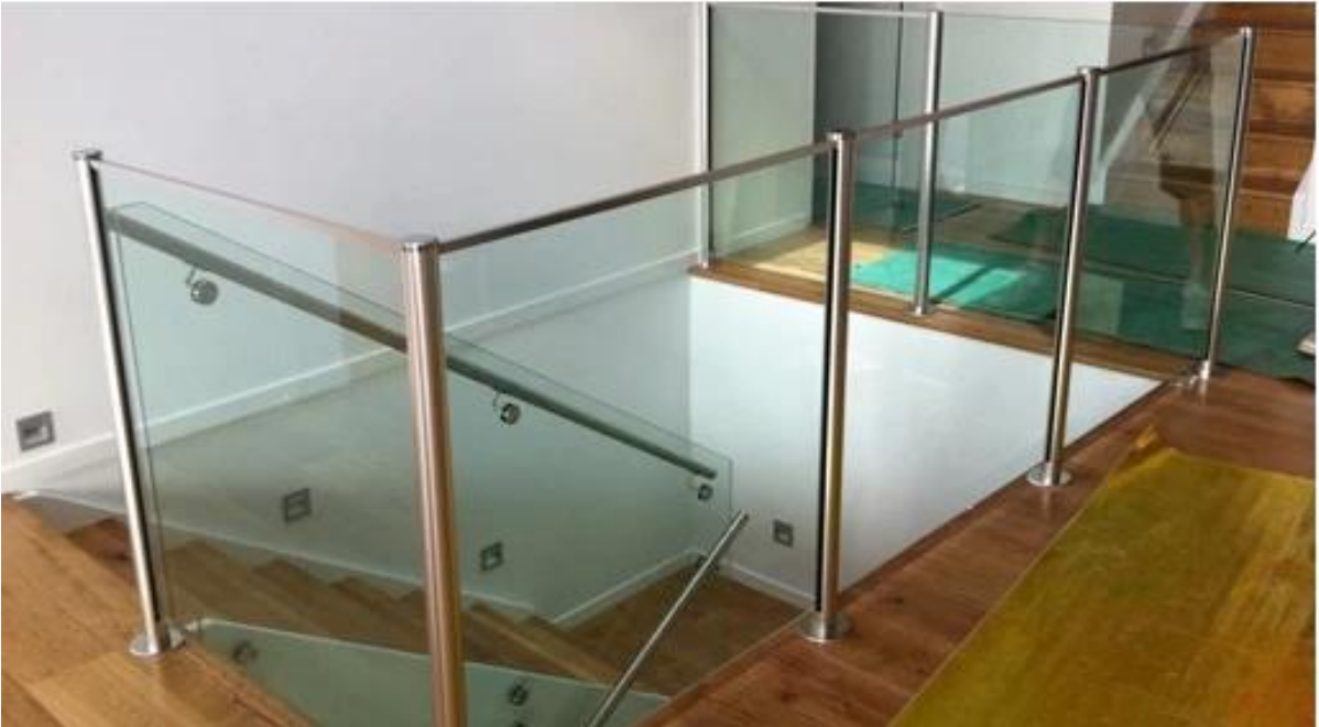
3. montaggio su palo di alluminio di forma quadrata laterale: