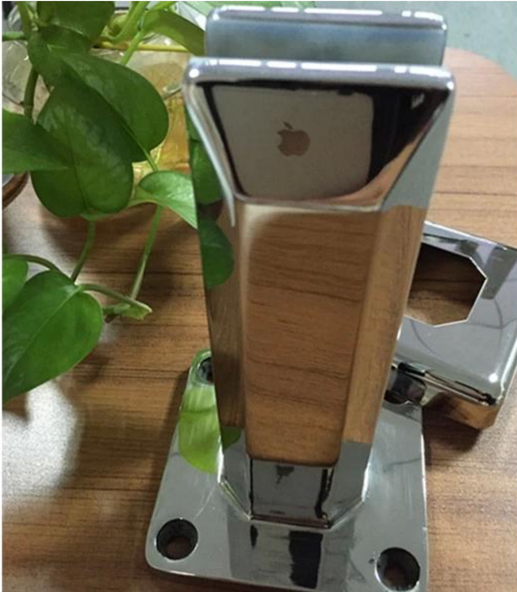
2.core vetro trapano rubinetto in forma rotonda e quadrata in finitura burhsed