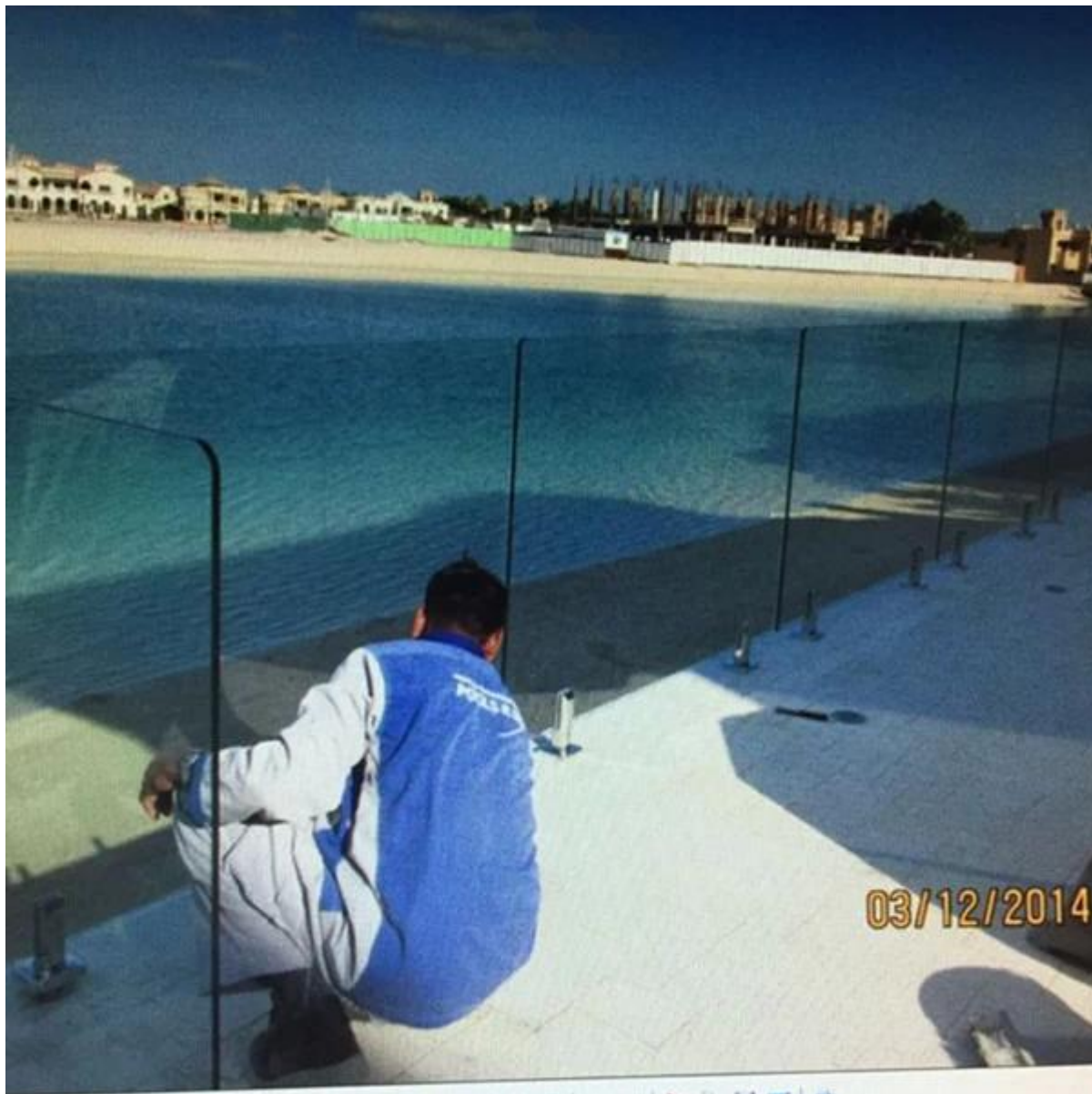
vetro perni per balcone