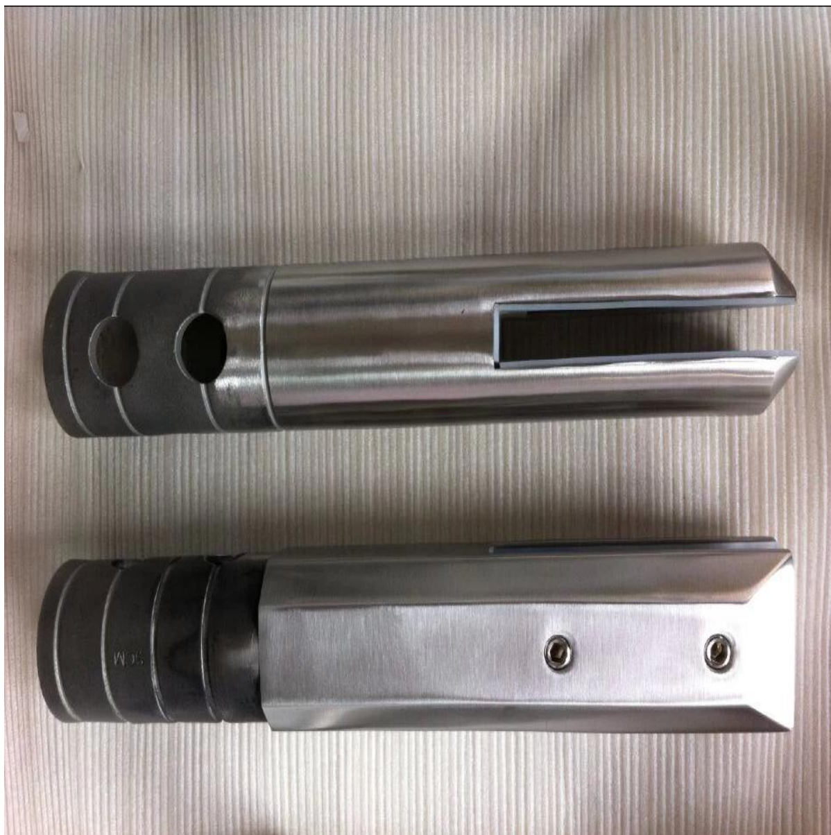
3. Four tipi di perni di vetro con piastra di copertura