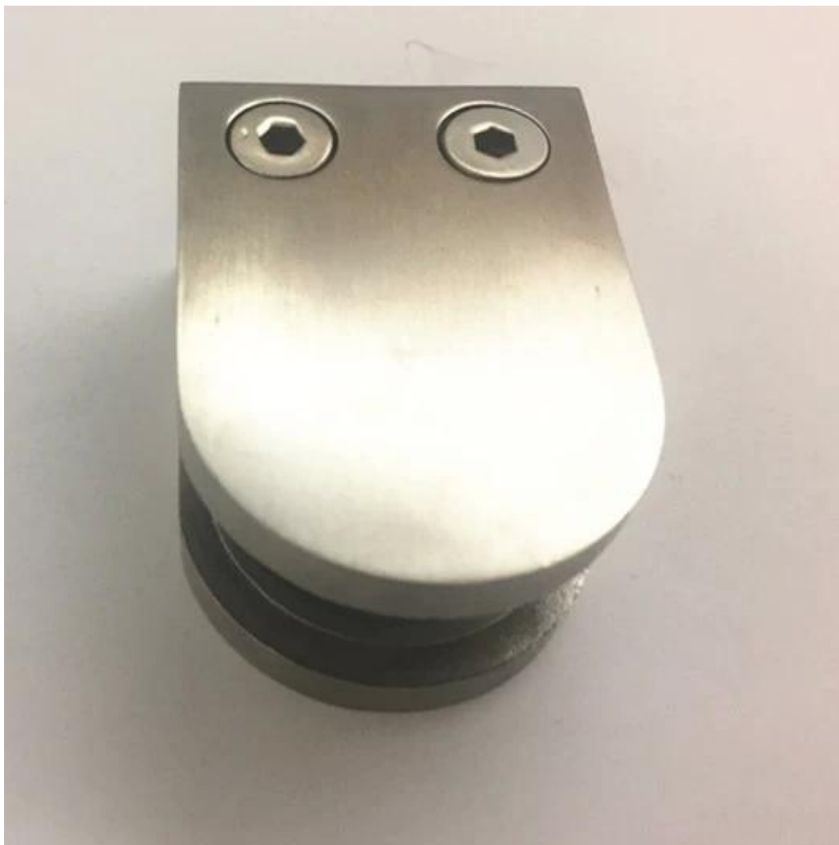
Vista di morsetti per vetro in acciaio inox satinato, con foro per la vite per ringhiera post montaggio dal basso