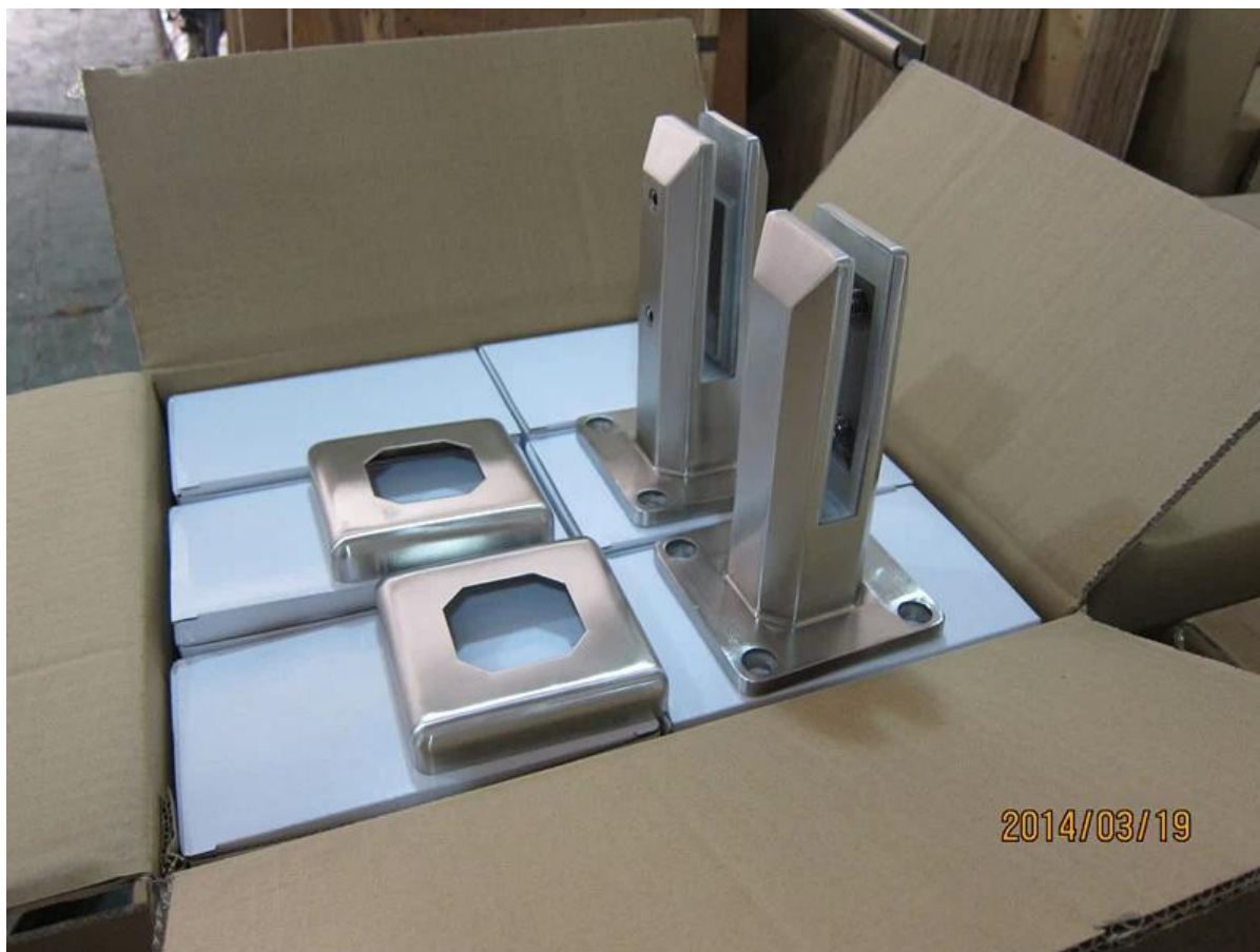
4. Foto di progetto in acciaio inox quadrato di vetro quadrato