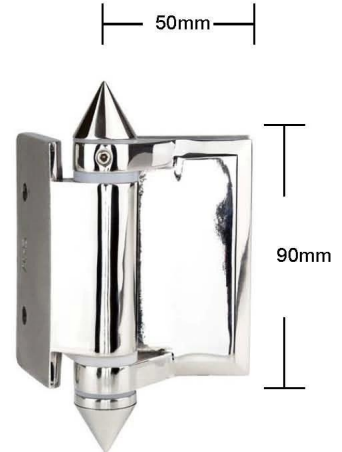
Part # G-W