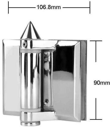
Part # G-G

Spring can be adjusted for closing speed control .