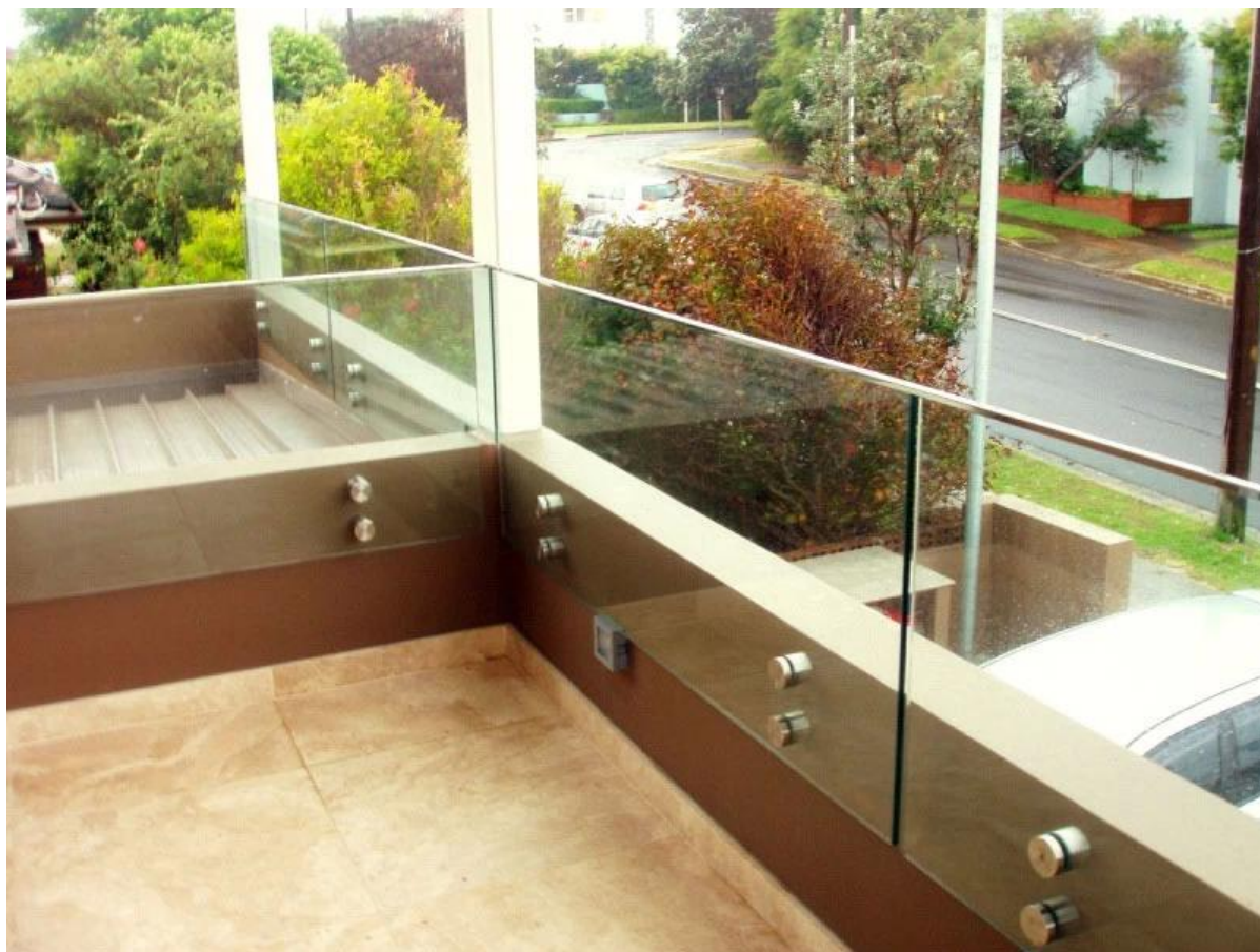
2). Sistema ringhiera in vetro stallo progettazione scala interna