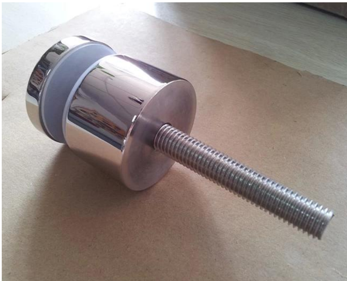
3). Modello n SF-50T supporto del pannello in vetro situazione di stallo.