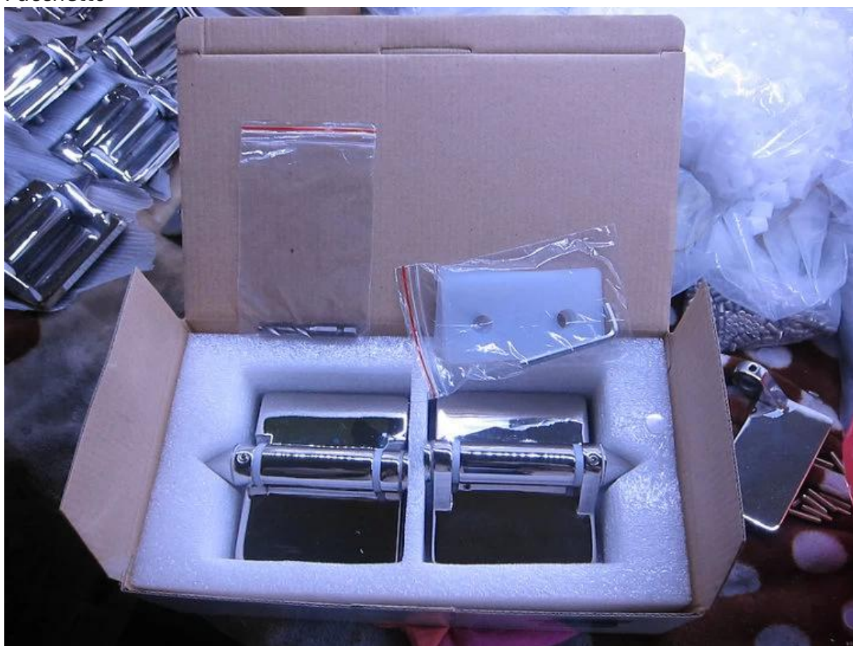
Molla, vetro a chiusura automatica a cerniera della porta in vetro, fatto da fusione.