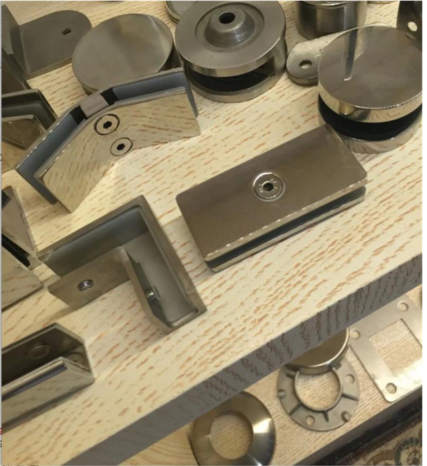
Progetto di ringhiere in vetro installate con morsetto per vetro CB-90: