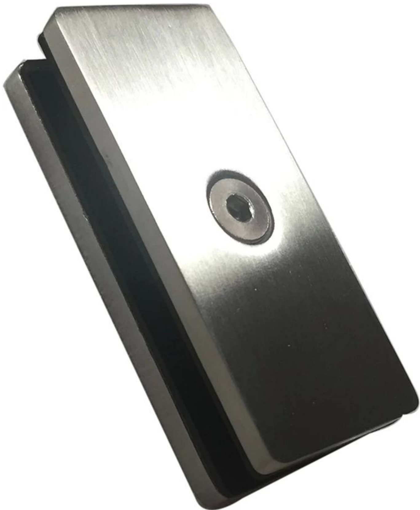
2. Morsetto per vetro angolare a 90 gradi utilizzato tra i pannelli di vetro all'angolo -