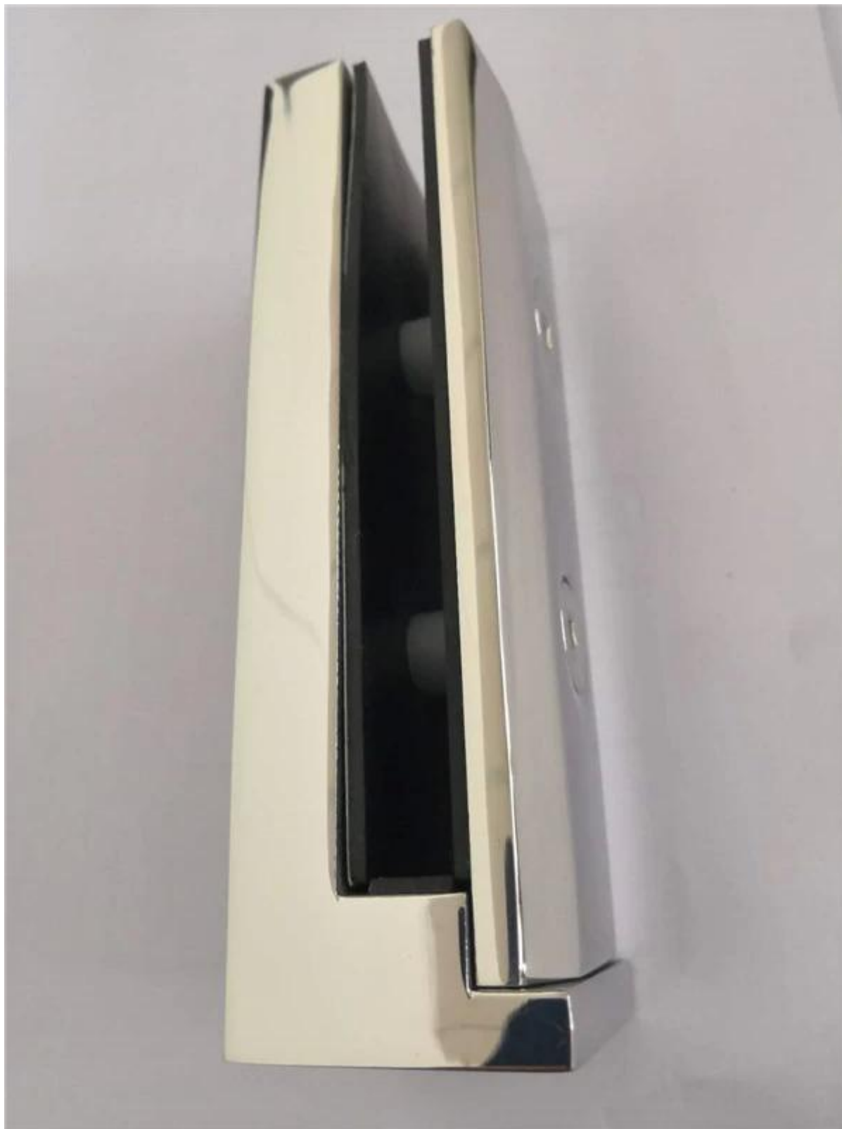
# Disegno del rubinetto di vetro montato lateralmente in acciaio inossidabile