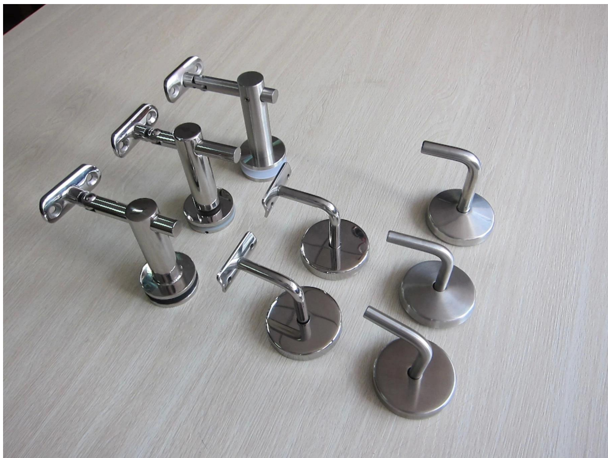
ringhiera delle scale di lusso pfoto rogetto: