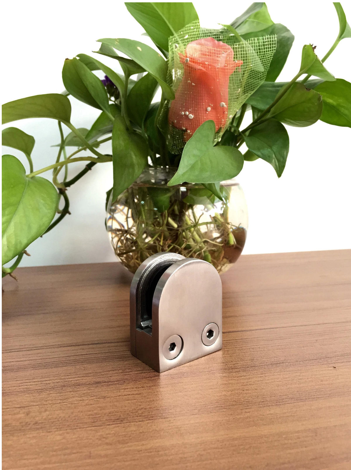
Modello no .: G105R