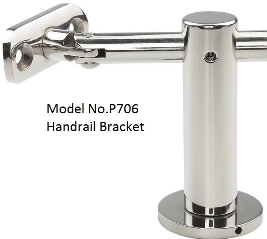
Model No.P706 Handrail Bracket