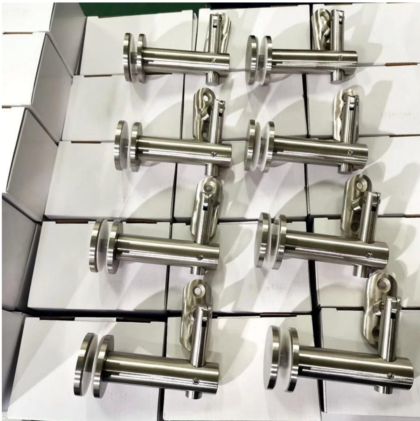
Foto del progetto del corrimano in vetro -