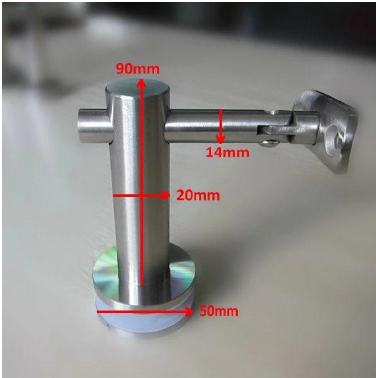
Progetto della staffa corrimano P707;