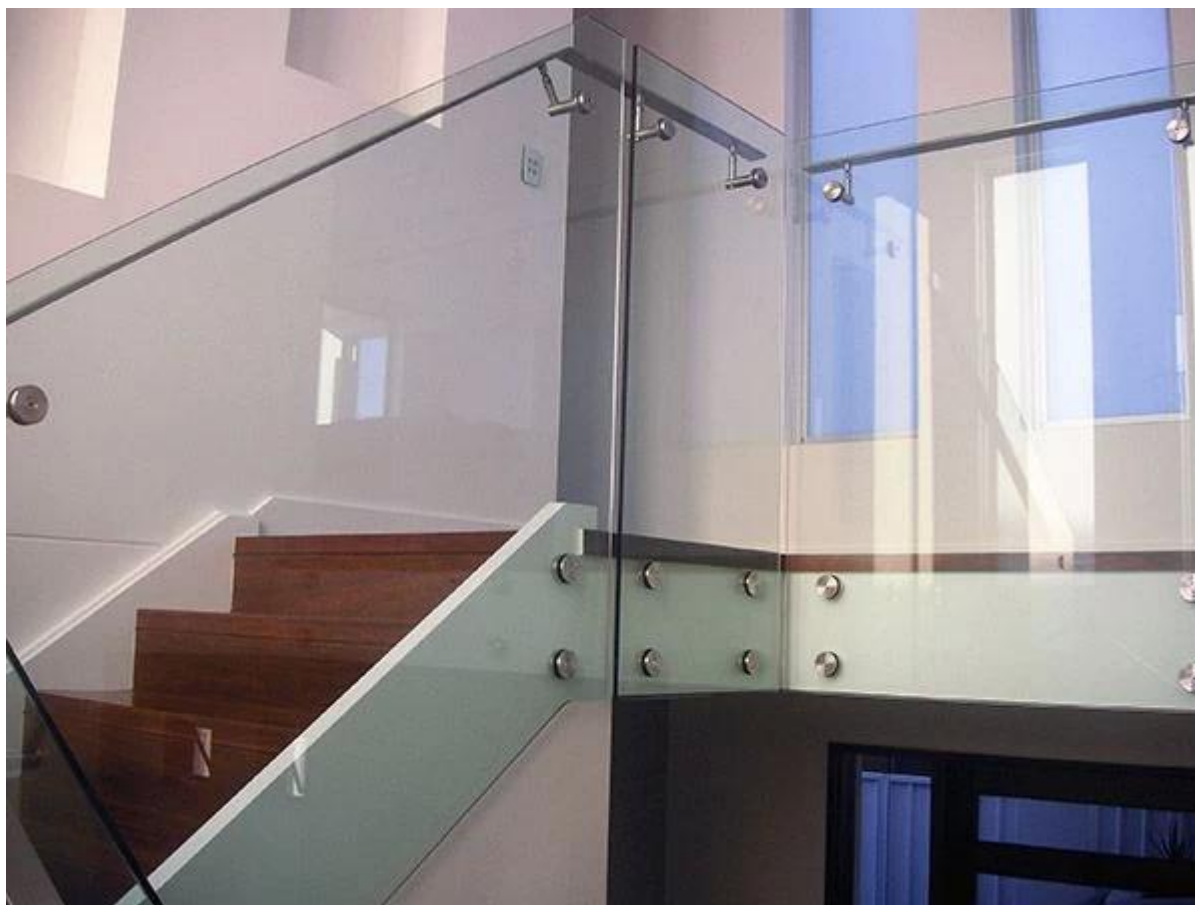
3) in acciaio .Stainless staffe di montaggio del pannello di vetro corridoio coperto disegno ringhiera in vetro