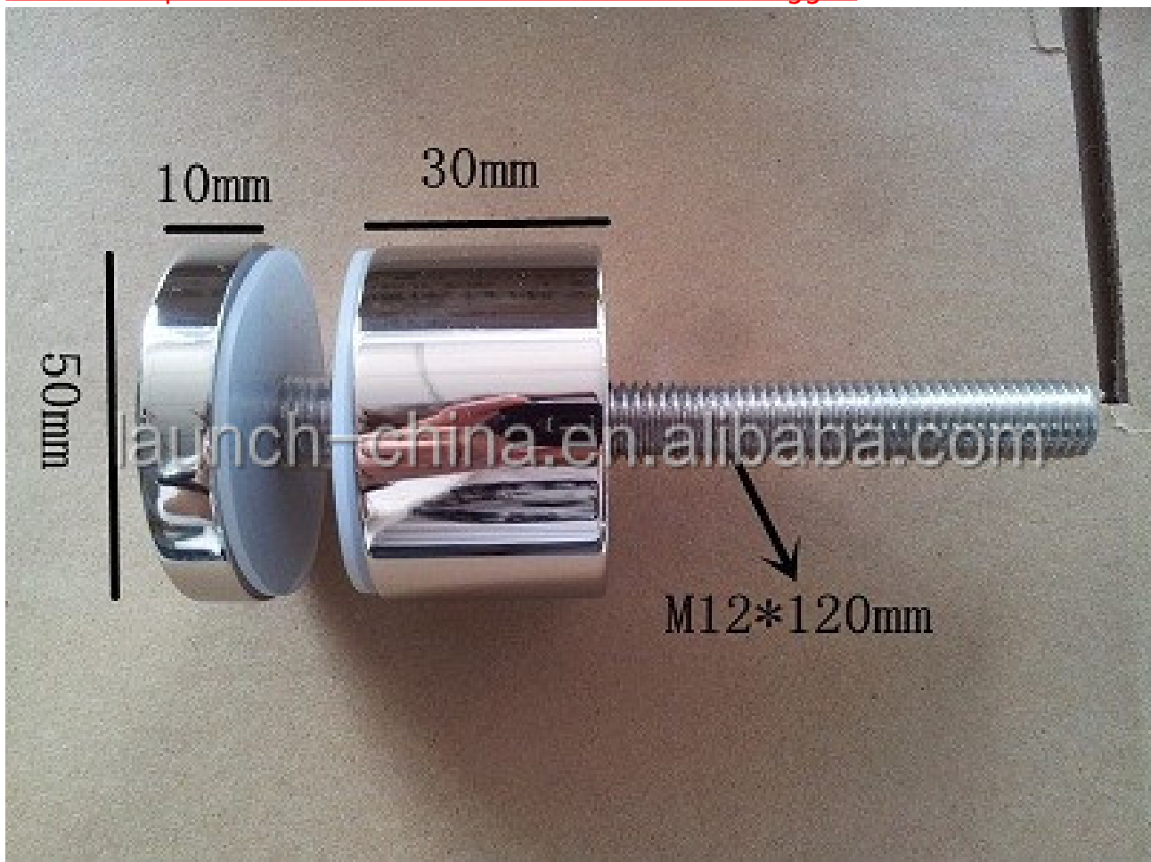
3. Modello pannello di vetro No. SF-50T staffe di montaggio.