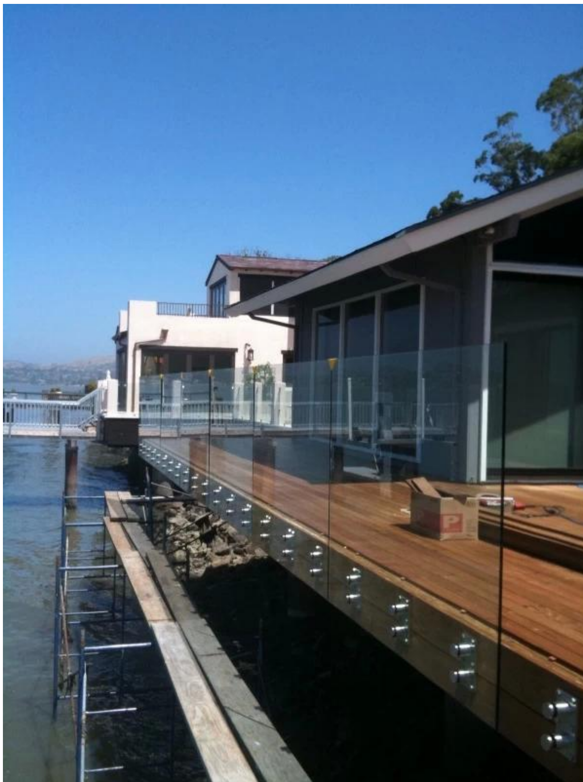
2) staffe di montaggio del pannello in vetro acciaio .Stainless Staircase disegno ringhiera in vetro