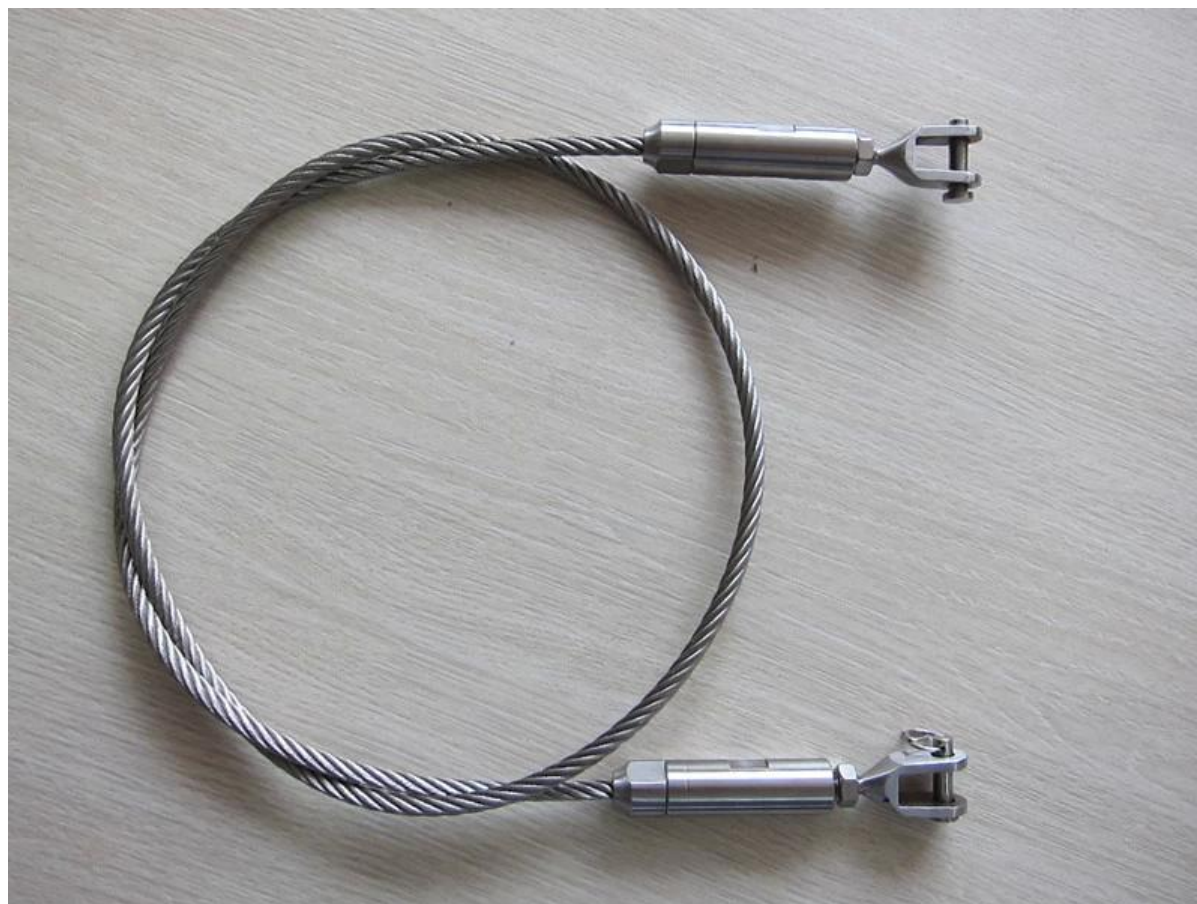
Regolatore di acciaio filo per ringhiera fune, tenditore del cavo per cavo ringhiera, ringhiera fune per balcone e scale