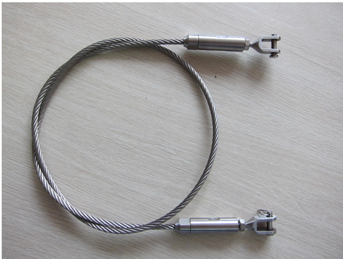
tenditore in acciaio filo molla in acciaio, per ringhiera fune, per scale balastra