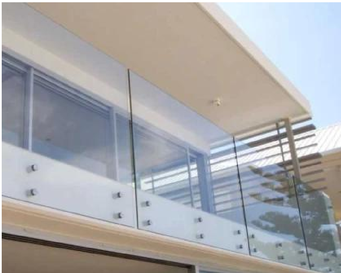
scala interna progetto di ringhiera di vetro,