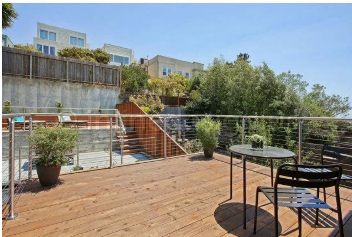
Cina lato disegno ringhiera balcone sistema di ringhiere cavo montato, sistema di balaustra laterale fisso fune