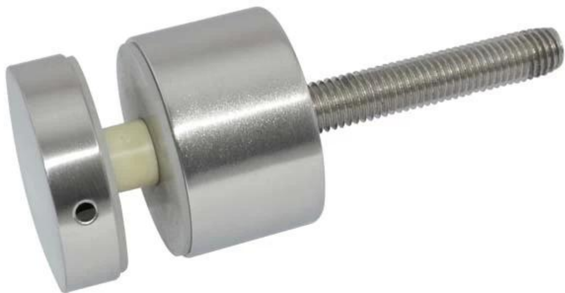
Foto van glas standoff beugel hout mount .