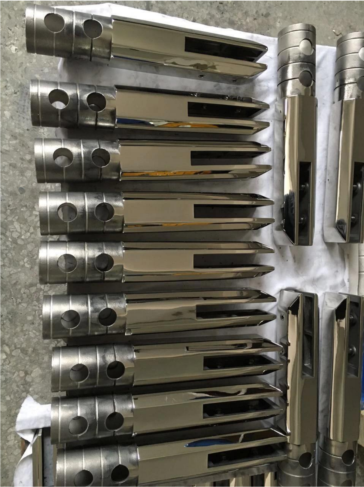
3) Glazen spigotfabriek