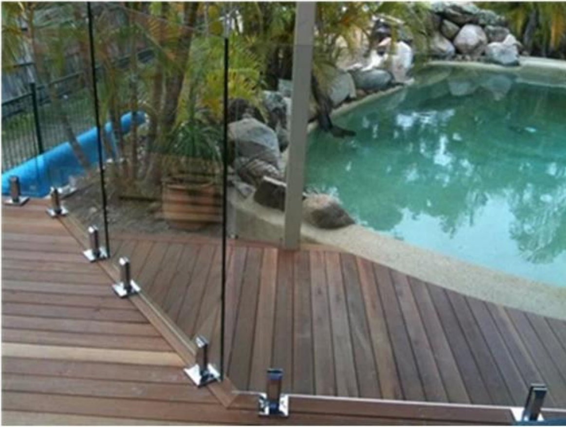
pool fence with square spigot