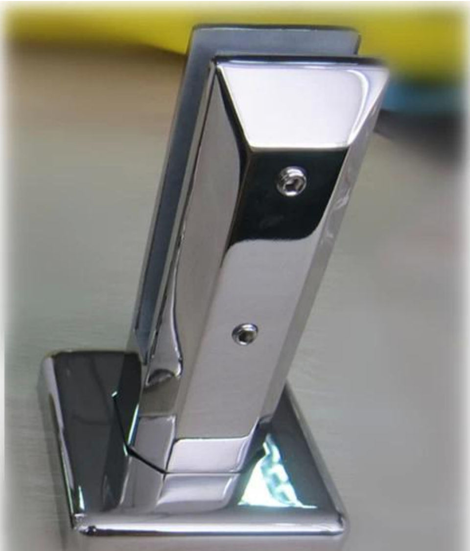
base plate spigot friction type SBM