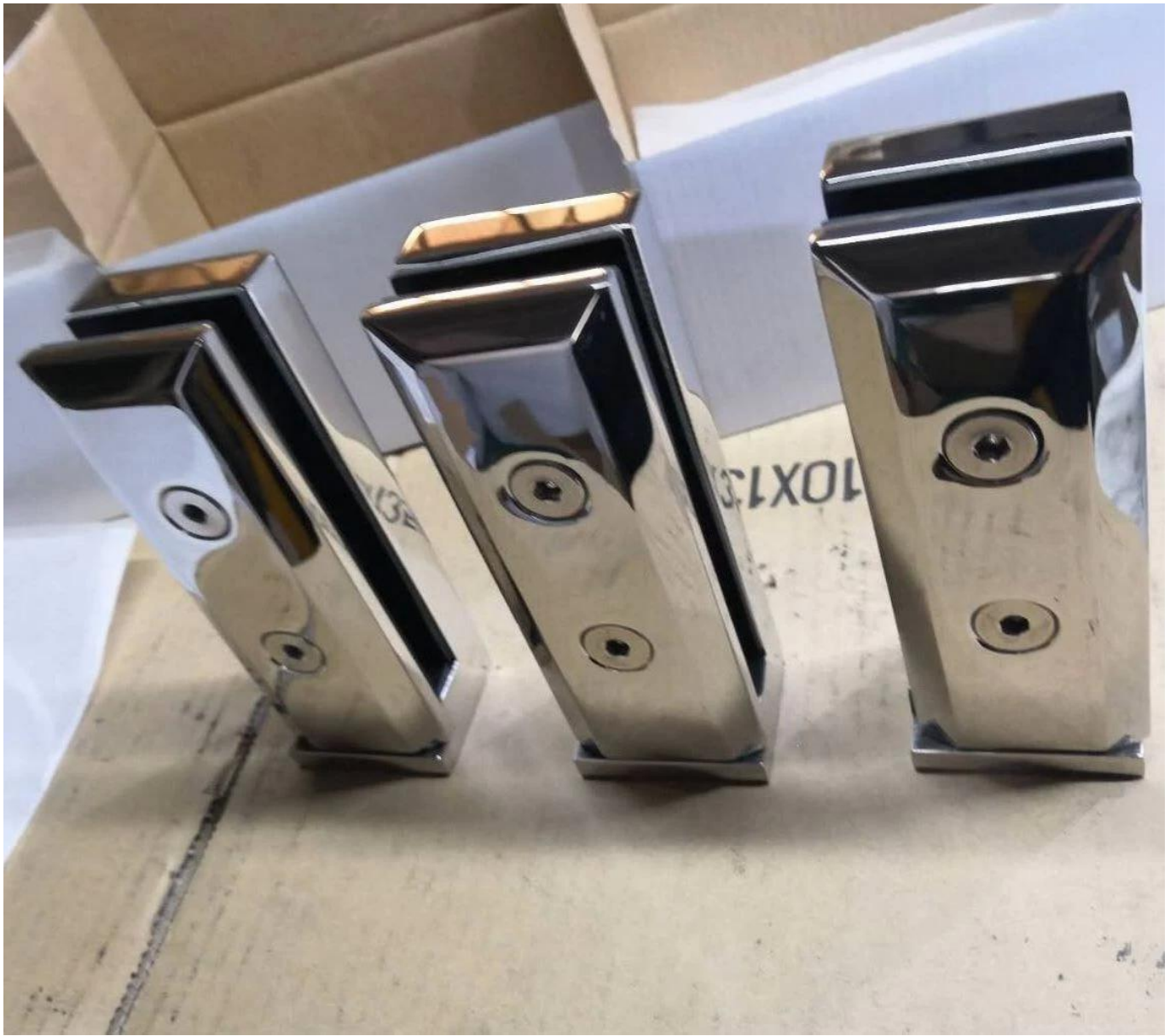
2) Side montage glazen spigot size