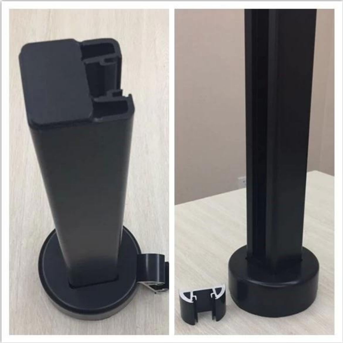
Power-coated in zwarte kleur - Zijkant gemonteerd: