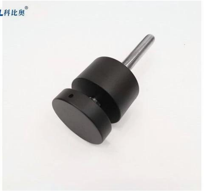
Roestvrijstalen glazen standoff productiepakket: