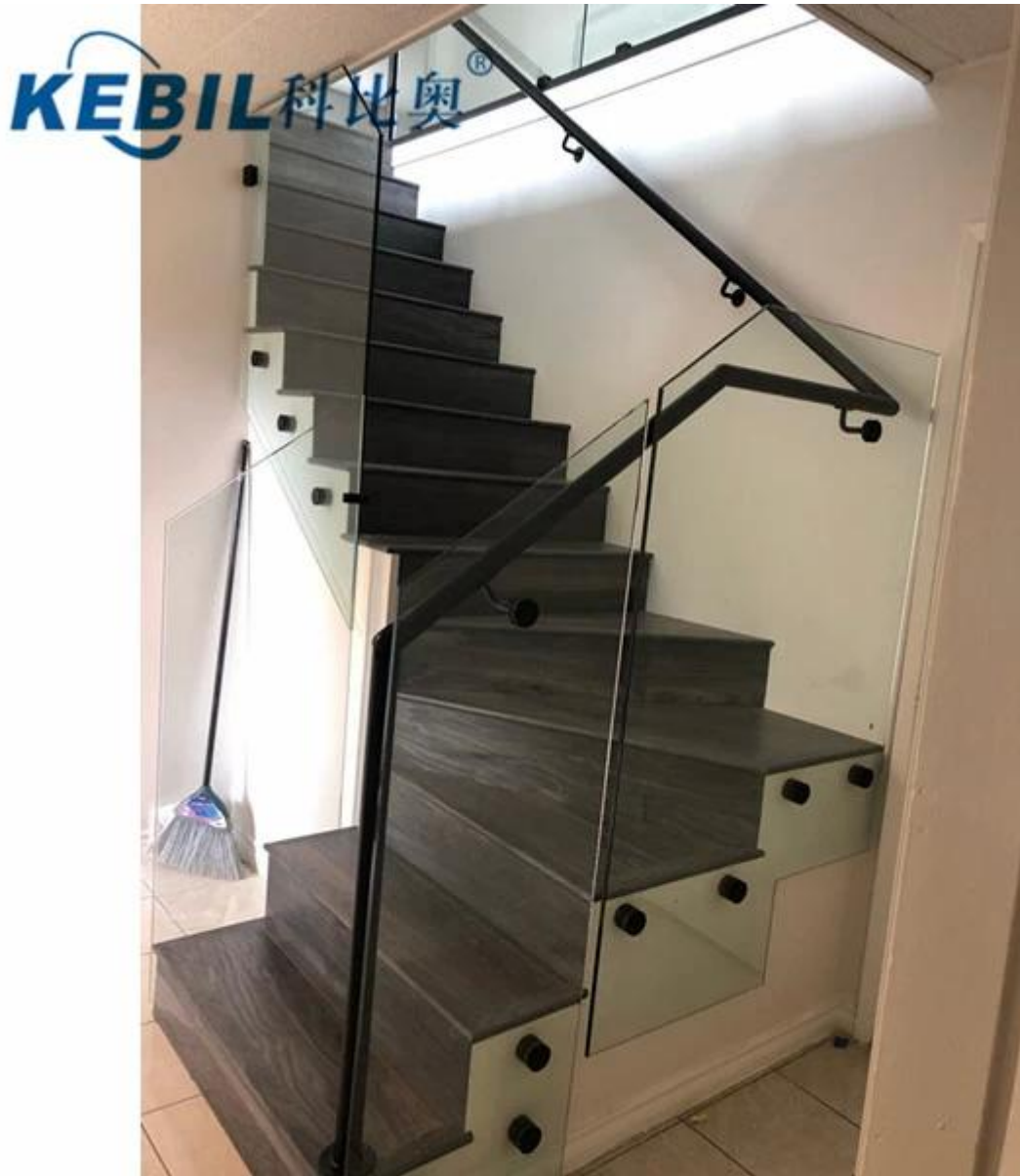
Glazen houder Afstandhouder Beugel Projectfoto's