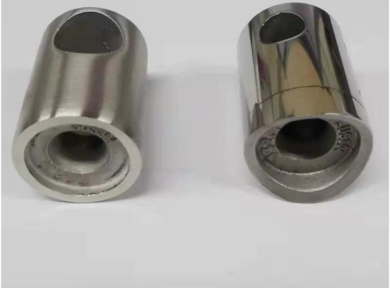
2. Verschillend Grootte Ontwerp voor Roestvrijstalen dwarsbalkhouder bar connector