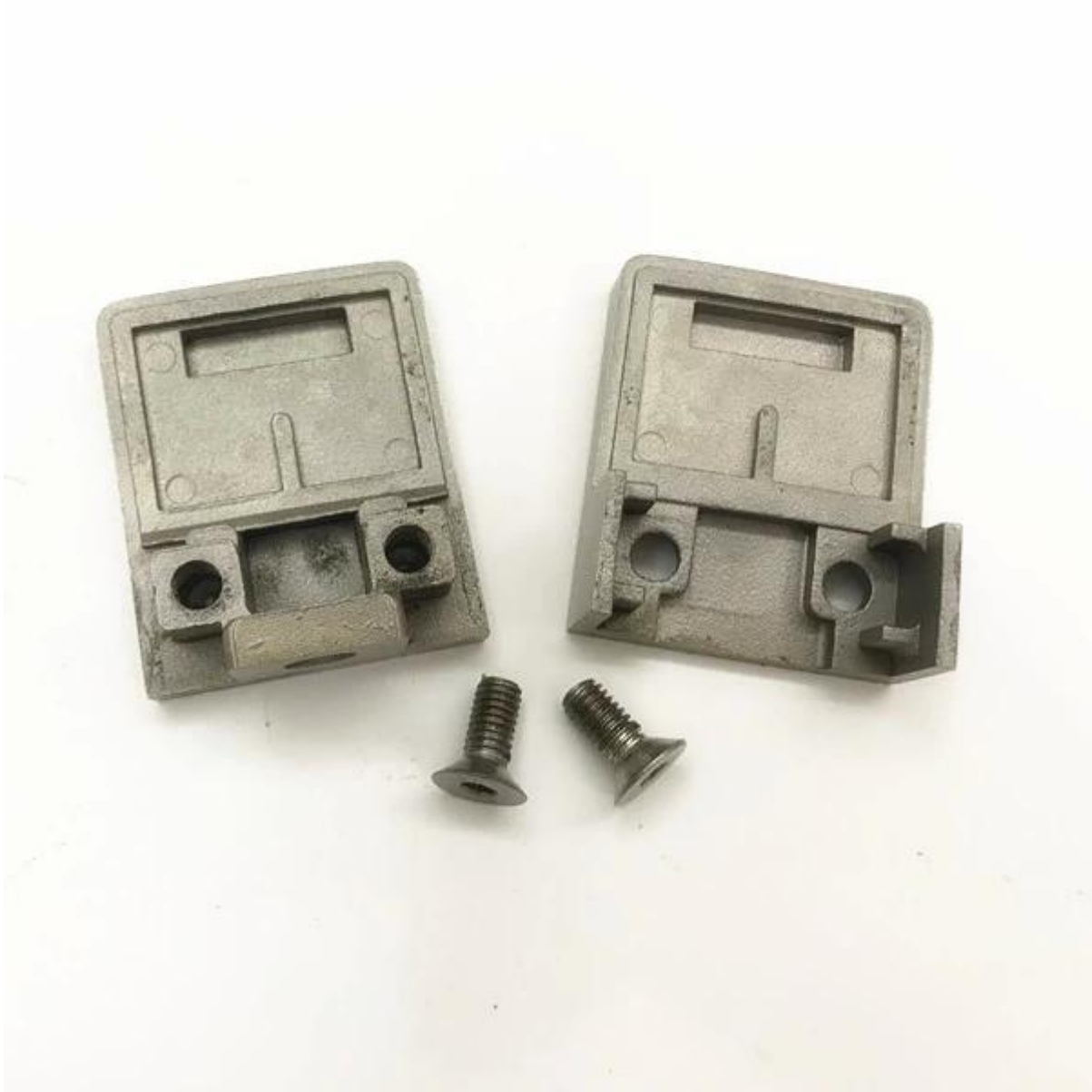
Witte kleurenpoedercoating van glasklem-