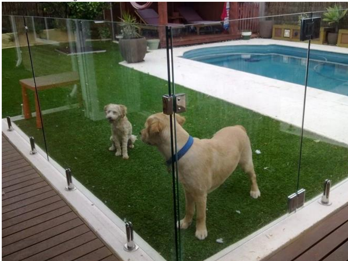
Hier is een van onze klant Stuur projectafbeelding: