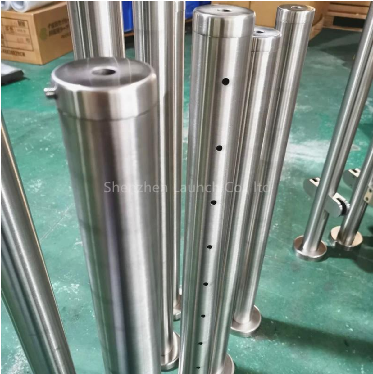
Kabelspanners passend bij kabelrailpalen-