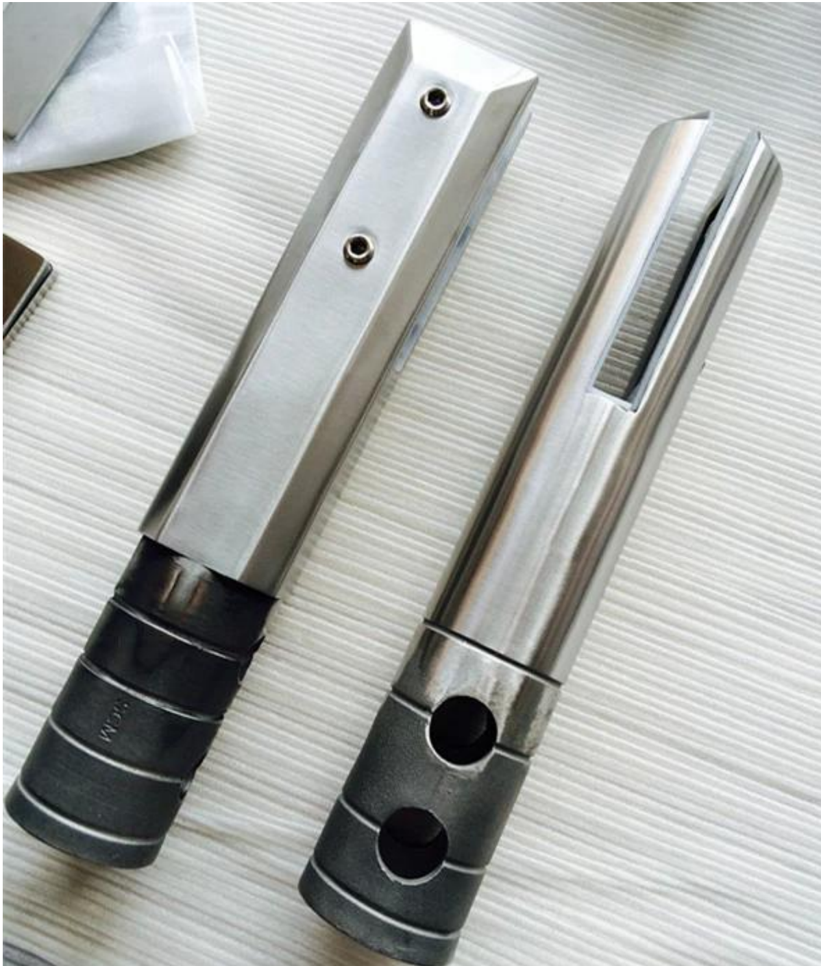
Vierkante vorm boorkern glas spon SCM-2